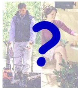
C. On ne peut pas le savoir

Pour chaque item, mets une croix dans la case correspondant à ton choix.