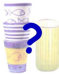
C. On ne peut pas le savoir

Pour chaque item, mets une croix dans la case correspondant à ton choix.