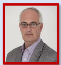
Χατζηδάκης Γιώργος Έφορος ΓΣΕΒΕΕ